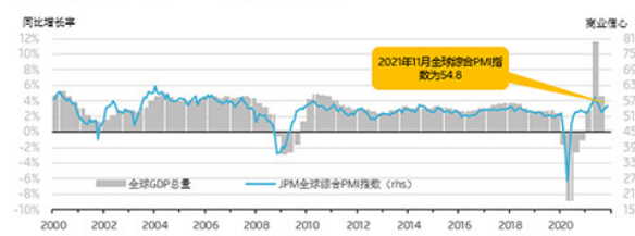
第四季度中期全球综合PMI指数保持稳定