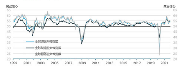
...由制造和服务行业驱动