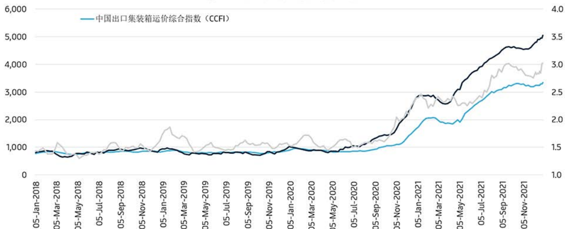
德意志银行拥堵指数与货运费率比较