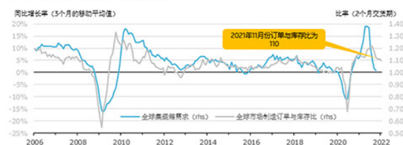
制造业的订单与库存比持续攀升.....